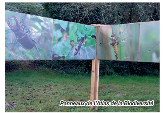
Panneaux de l'Atlas de la Biodiversité