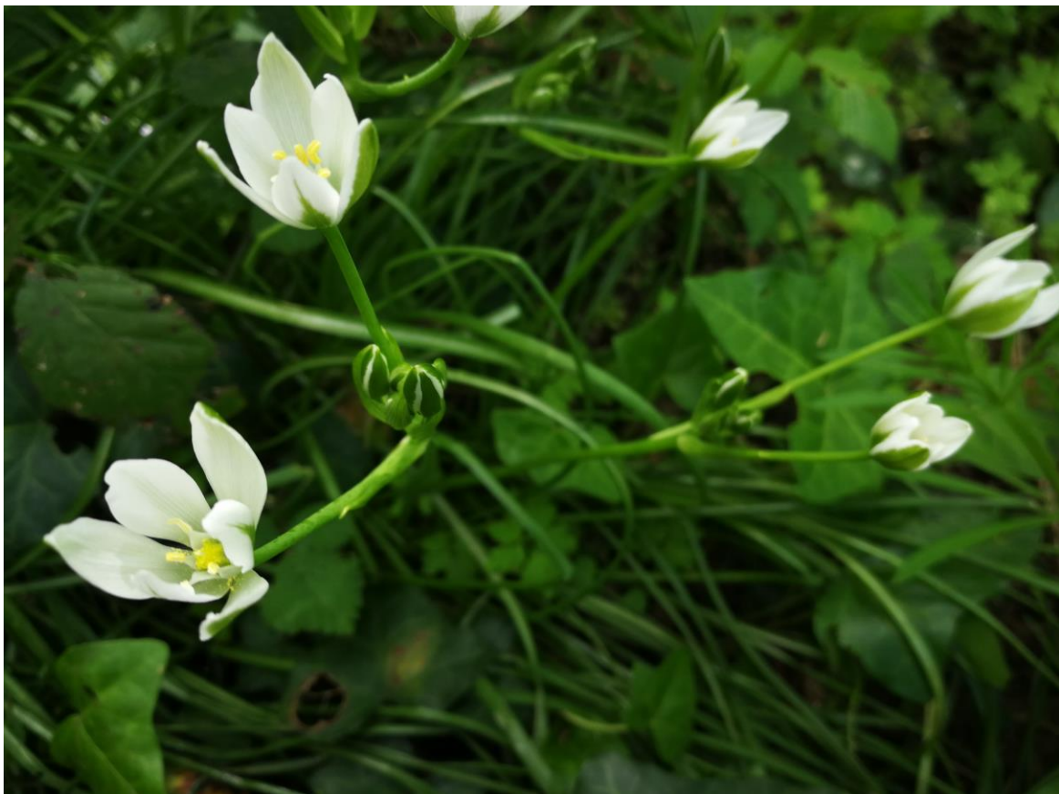
Figure 2 : Ornithogalum umbellatum L.

Pour les mares communales situées au sud de la commune, il serait pertinent de les faucher tous les ans en septembre afin d'éviter leur colonisation par les arbres comme c'est le cas aujourd'hui. De plus, une imperméabilisation naturelle (argile) pourrait être envisagée. La plupart d'entre elles ne retiennent en effet que très peu l'eau.