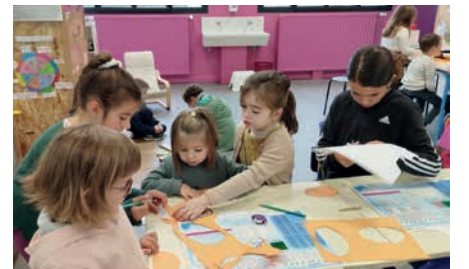
Ateliers de parrainage

Pour toutes questions relatives à la scolarité à l'école Sainte Anne, contactez Marielle Lechat, cheffe d'établissement : ec.maisdon.ste-anne@ec44.fr - 02 40 06 62 73