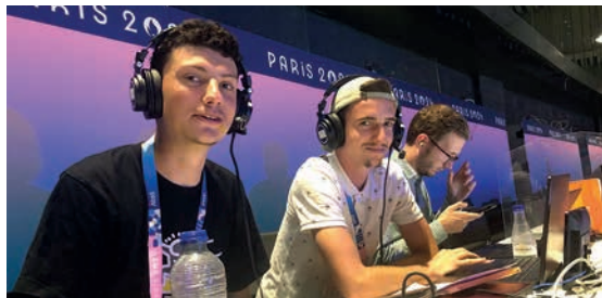
Jeux olympiques de Paris du 9 août 2024 au Parc des Princes pour la finale de Football « Espagne/France » et le 10 août 2024 pour une session d'athlétisme au stade de France.