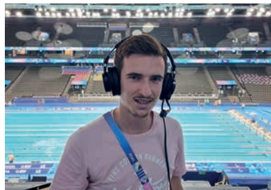
Jeux para-olympiques de Paris le 29 août 2024 pour la para-natation et le 7 septembre 2024 au stade de France pour le para-athlétisme.